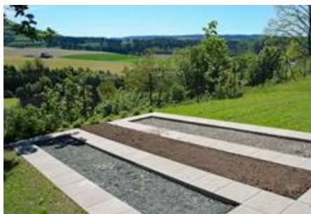
Reihengrabstätte für eine Urnenbestattung mit Pflege des Grabes durch die Angehörigen

Im Namen des Presbyteriums Ursel Groß, Pfn.