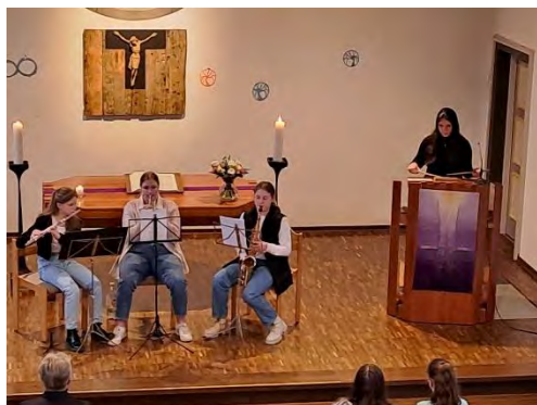
Musik zu Beginn